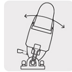
Capacidad de biselado 0 - 45° por ambos lados